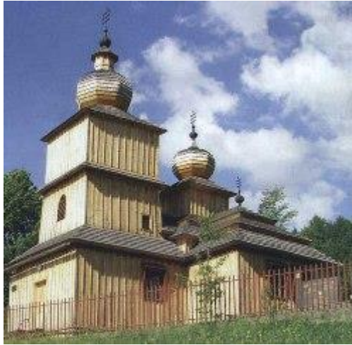
Dobroslava (39 km)

Drevené kostolíky sa svojou originalitou, technicko-umeleckým riešením a spoločenským významom zaradili medzi národné kultúrne pamiatky.