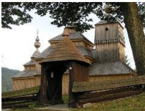
Bodružal (42 km)

Pre drevené kostolíky v regióne je charakteristická bohatá umelecká výzdoba. Na mnohých chrámoch sa zachovali rôzne ozdobné kupoly, kužeľovité a pyramidálne ukončenie striech. Na vežiach sa objavujú barokové makovicky ukončené železnými kovanými krížmi, ktoré sú výrazným umeleckým prejavom dedinských kováčov. Vyznačujú sa pestrosťou foriem a veľmi bohatým ornamentom.