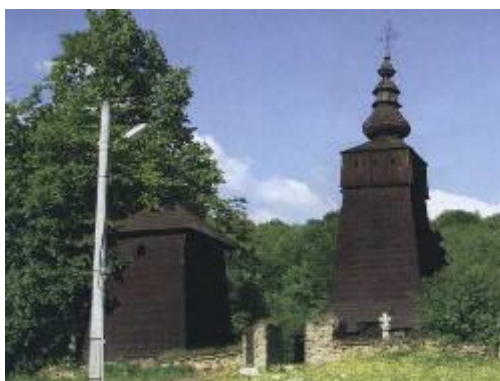
Potoky (25 km)