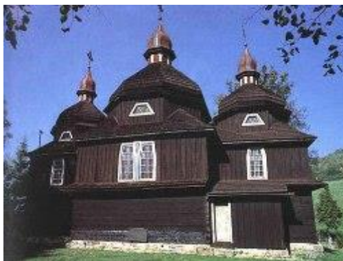
Nižný Komárnik (45 km)